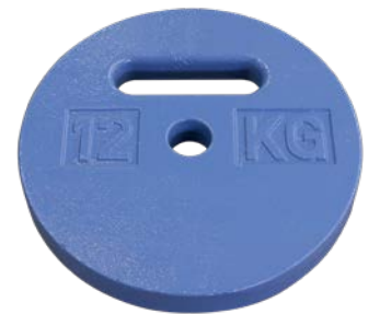
Ballastgewicht Art.-Nr. 01912