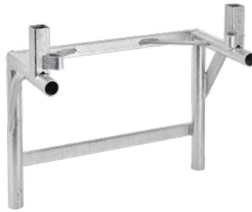
Rutschenrahmen Art.-Nr. 01904