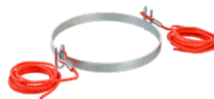
Führungring Art.-Nr. 01918

Weiteres Zubehör finden Sie unter: www.geda.de