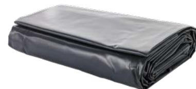
Container-Abdeckplane Art.-Nr. 01917