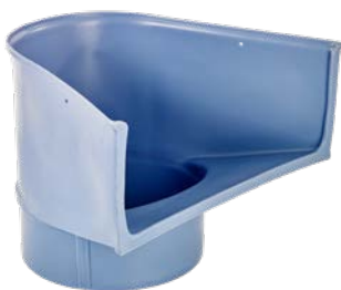
Einfülltrichter Art.-Nr. 08922