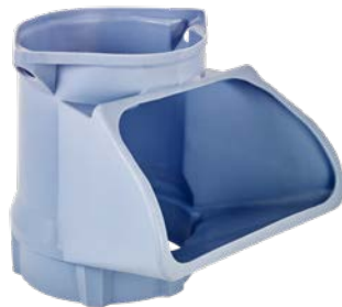
Einfülltrichter Art.-Nr. 01921