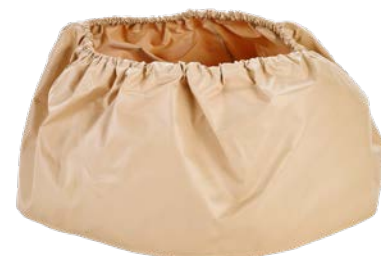
Staubschutzmanschette Art.-Nr. 01913