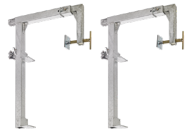
Satz Brüstungsklammern Art.-Nr. 01902