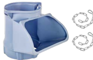
Rutschenabzweig mit Ketten Art.-Nr. 01922