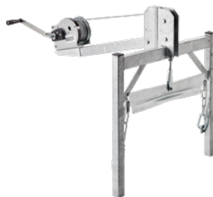
Handwinde (41 m Seil) Art.-Nr. 01908