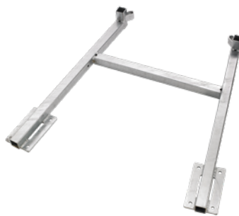
Flachdachrahmen (Festmontage) Art.-Nr. 52104