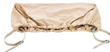
Staubschutzhaube Art.-Nr. 01909